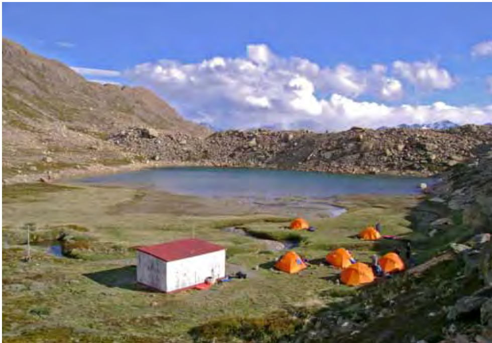
Camp beim Refugio Paso del Viento