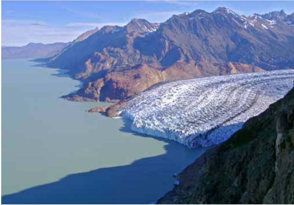
Blick vom Camp Huemul auf den Lago Viedma und Viedma Gletscher