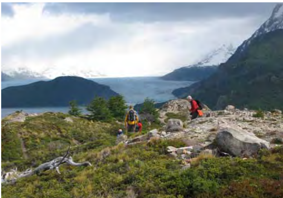
Entlang dem Lago Grey, Foto: Tinu Stettler