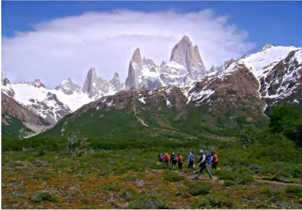
Unterwegs im Los Glaciares Nationalpark, im Hintergrund Fitz Roy Gruppe