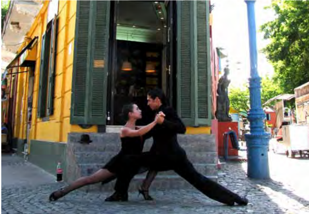
Caminito ist auch eine Hochburg des Tango, Foto: Tinu Stettler