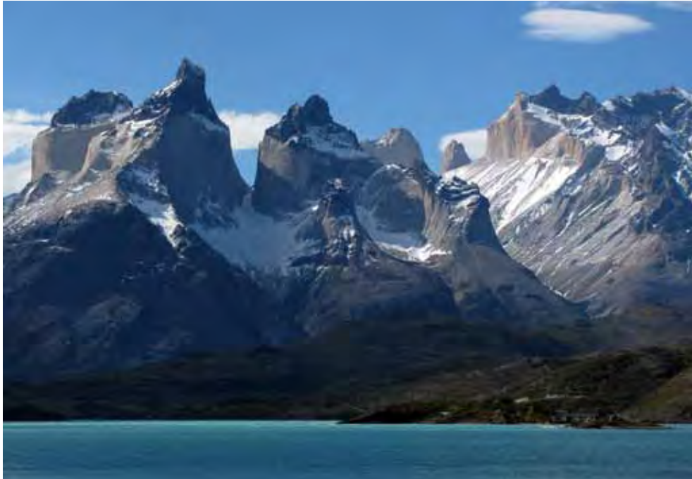
Cuernos Gruppe im Torres del Paine Nationalpark, Chile, Foto: Tinu Stettler