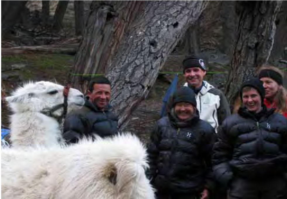
Lamas tragen die Lasten ins Toro-Camp, Foto: Tinu Stettler