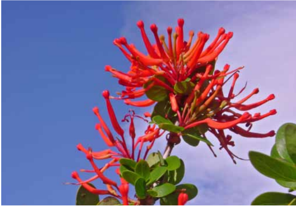
Der «Notro» (Feuerbusch), in Patagonien weit verbreitet, Foto: Tinu Stettler