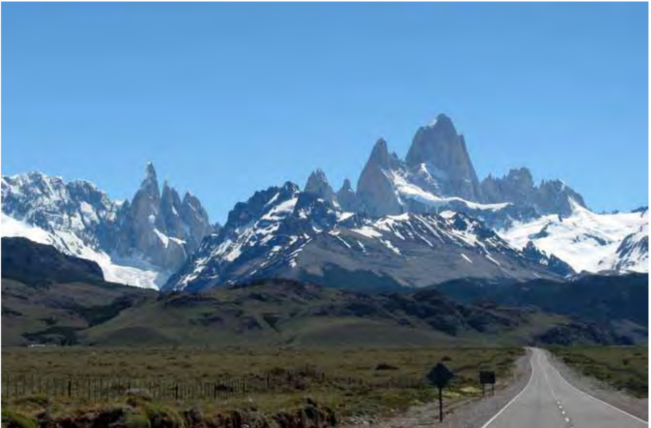
Kurz vor El Chaltén: die Torre- und Fitz Roy Gruppe

Leitung: Thomas Dünsser dipl. Bergführer IVBV