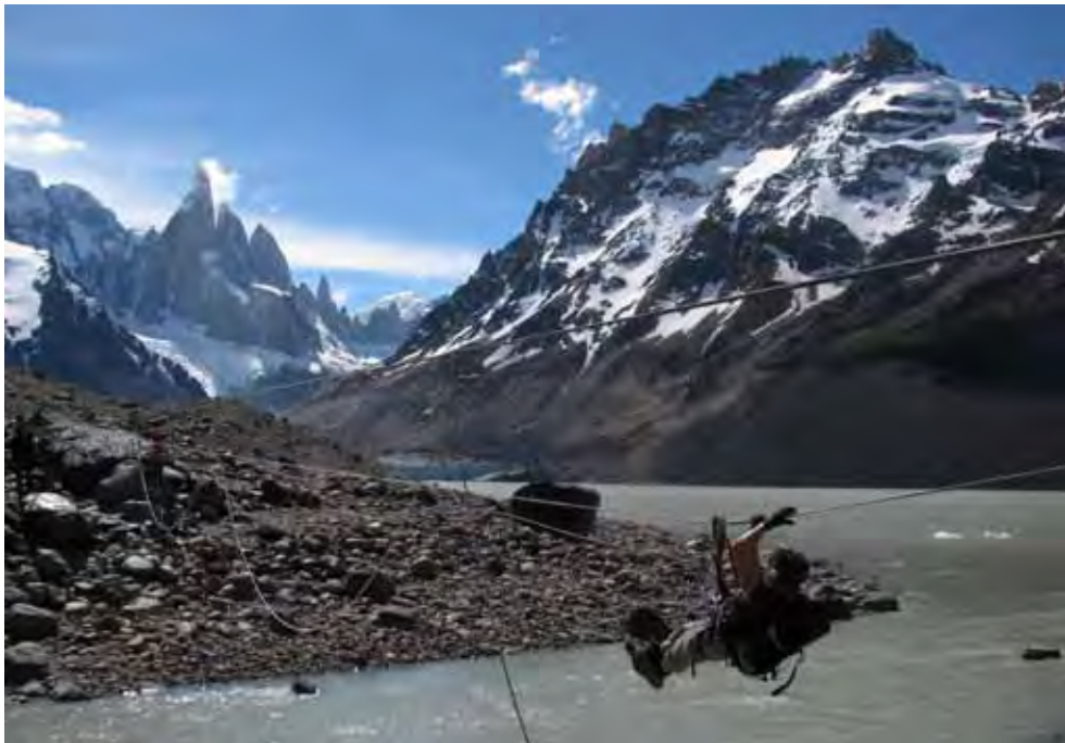
Die Tyrolienne an der Laguna Verde