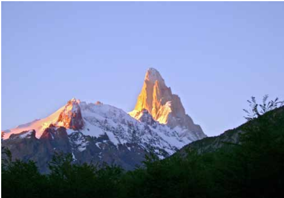
Fitz Roy im Morgenlicht, Foto: Tinu Stettler