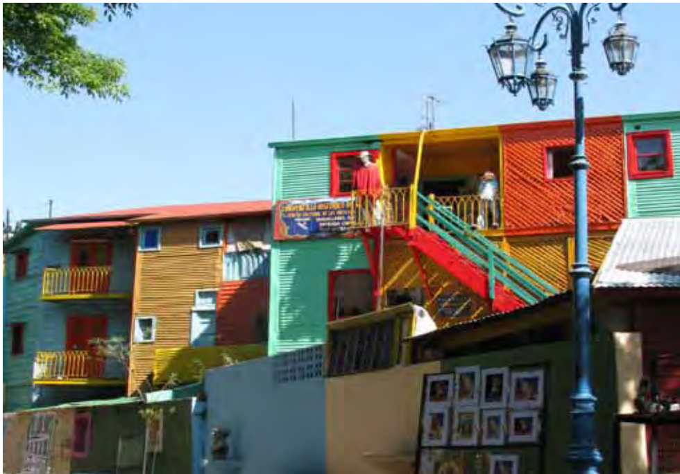
Caminito, La Boca, berühmtes Arbeiterviertel in Buenos Aires